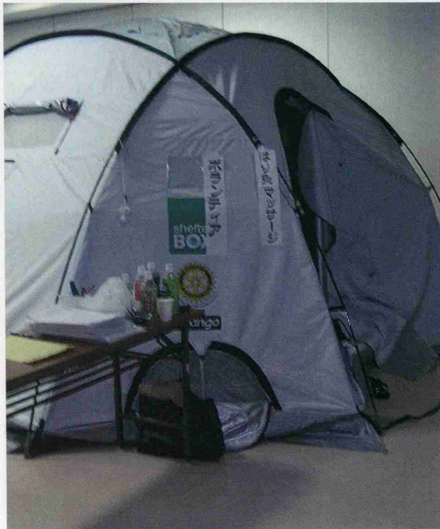
受付テーブルと施術テント

室内食堂前のスペースにテントを2つ設営し、1つは施術スペースとして使い、もう一つは就寝用に使用している。